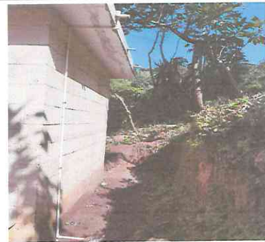
Foto 6: Finalización de de instalación de tubería de agua entubada.

Observación: Si es necesario se pueden agregar hojas adicionales y actualizar el número de hojas.